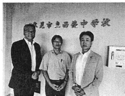
ハンドボール部顧問