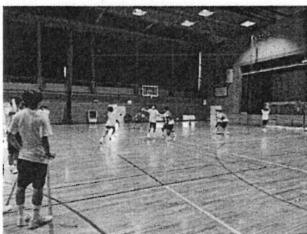
西條中学校ハンドボール部練習視察