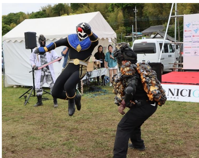
▲悪役(右)と戦うヒーロー・テガヌマンクート(左)