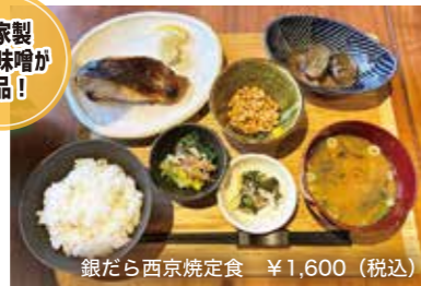
銀だら西京焼定食 ¥1,600 (税込)