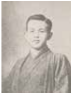
石川啄木