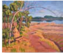
原田京平「ハケの道と手賀沼2」(1924)