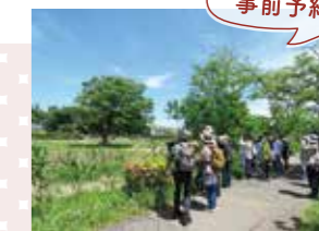
(バードウィーク手賀沼探鳥会)

集合場所: 水の館 東側 Enjoy 手賀沼本部テントブースにて受付 定員: ①先着40人 ②先着60人 ※いずれも小学生以下は保護者同伴 参加費: 無料 当日受付 事前申込不要 雨天時: 9:30から鳥の博物館入口で受付 10:00~11:00 鳥の博物館ガイドツアー