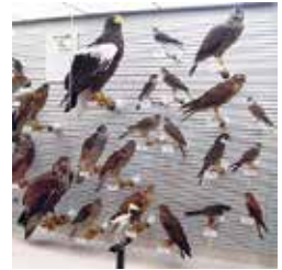
特別企画「日本の鳥」

鳥の博物館では、身近な生き物である鳥について理解を深めてもらえるように、日本産鳥類全種のはく製標本の収蔵を目標に資料の収集を進めています。今回の展示では、これらの標本をできるだけ多く展示し、地域や環境、季節によっても異なる日本の鳥の多様性をご紹介します。