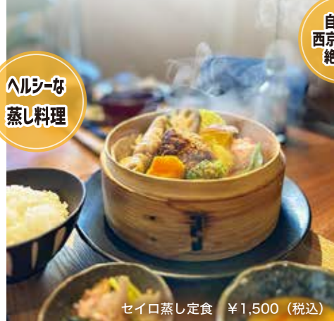
セイロ蒸し定食 ¥1,500 (税込)