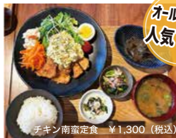
チキン南蛮定食 ¥1,300 (税込)