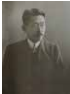
杉村楚人冠

同じ東京朝日新聞社の職員として、楚人冠と啄木は友情を育みました。そんな啄木が楚人冠に宛てた書簡や、両者をめぐる人々の資料を展示して、楚人冠と啄木の関係をご紹介します。