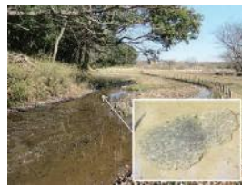
春を告げるニホンアカガエルの卵

【申込期間・方法】 ちば電子申請サービスにて申込み(先着順) 2月18日(土) 8:30(受付開始)～2月28日(土)まで