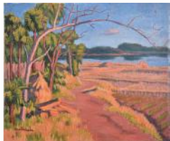
原田京平『ハゲの道と手賀沼2』(1924)