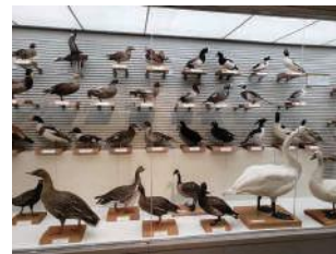
過去の展示の様子

鳥の博物館では、身近な生き物である鳥について理解を深めてもらえるように、日本産鳥類全種のはく製標本の収蔵を目標に資料の収集を進めています。今回の展示では、これらの標本をできるだけ多く展示し、地域や環境、季節によっても異なる日本の鳥の多様性をご紹介します。