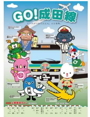
【オリジナルクリアファイル（イメージ）】