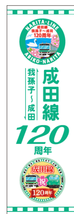
【のぼり旗（イメージ）】