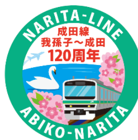
【ヘッドマーク（イメージ）】