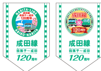
【フラッグ（イメージ）】