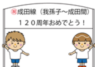
【「10万人が手を振ろう！」（イメージ）】

駅ホームでは、係員の案内に従い、黄色い点字ブロックの内側でお待ちください。 線路沿いの柵には上がらず、踏切等から線路内に立ち入らず安全な場所からお楽しみください。 また、私有地への立ち入りはご遠慮ください。