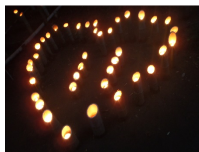
昨年度からはじめたフォトスポット