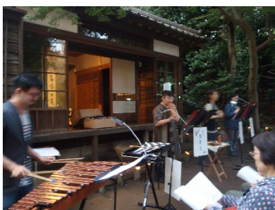
昨年度のコカリナ演奏の様子