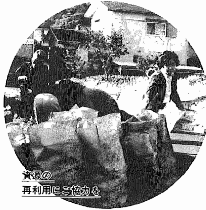
資源の再利用に協力

市民のみなさんの協力で昭和56年1月から始まった資源化事業は、順調に進み定着してまいりました。しかし、近年の生活様式の変化により、「三分多様化」しています。「三分多様化」資源の再利用を考え、なお一層のご協力をお願いします。 フリンセマー ☎8700015