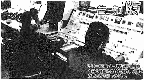
シリーズコム=消防署司令部 1日の通話料は約20分、火事 が原因で発生した。