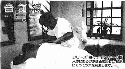
シリーズ「働く人」のコーナー。二人人体にあるツボは通常356ヶ所、経絡にツボを刺します。

昭和63年11月1日現在 (対前年比) *人口117,938人(+2,583人) 男59,356人 女58,582人 *世帯数36,910世帯(+1,153世帯)