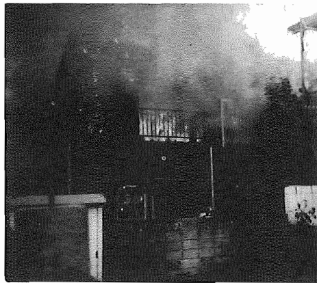
火災は、一瞬にして命や財産を奪います。

その火その時、すい煙、を周囲一帯に11月26日から12月1日までの1週間、秋の火災予防運動を展開。火災の防止には、ちよとした気配のゆるみや注意で起つてしまふ、何でもないかなことを行つて大まな火災が防ぎます。又は出さないの心算をたて、もう一度火の取り扱ひ方を手直ししておきましょう。—消防本部—