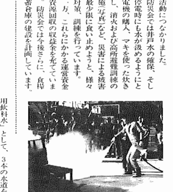
用飲料水として、3本の水道を確保しています。もちろん電気も確保しています。さらには各家庭に非常食を配置して計画です。