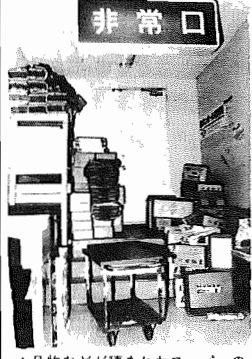
非常口。品物などが積まれたスーパーの非常口。すわ火事というときは...

消防署では、火災予防運動にちなみ、ガソリンスタンドなどの危険物施設やスーパーマーケットなどの事業所、学校などの立入検査を行います。