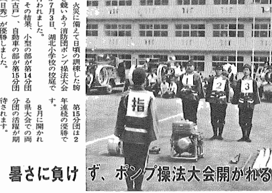
暑さに負けず、ポンプ操法大会開かれる