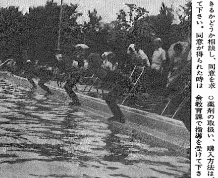
▲体をきたえて、暑さなんかふっ飛ばせ

この他、我孫子市青年館設置及び管理に関する条例の一部を改正する条例、市道路線の認定についてなどが提案され可決されました。