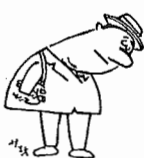
旅行靴「エンピツがさきよ」

第四小学校体育館 ◎投票日時 一月十九日(日曜日)午前七時から午後六時まで ◎開票事務をあわせて行なう選挙の日時場所 一月十九日(午前七時半から) 我孫子中学校体育館 ◎不在者投票期間 一月九日から一月十八日まで ◎補充立候補届出期間 一月十一日から一月十六日まで ◎選挙に関する諸届出時間 市長、市議会議員補欠選挙に関する申請、届出等時間は、土、日曜日にかかわらず午前八時三十分から午後五時までです。