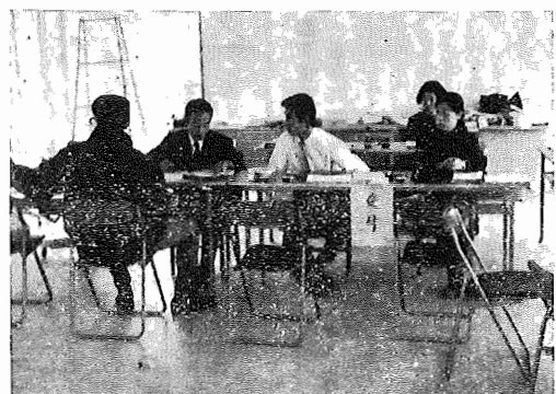
湖北台支所での受付

土木費 道路維持費に一千四百万円余り、道路新設改良費に五千二百三十七万二千円を計上いたしました。町の整備に努める所存であります。都市計画費では、都市計画図