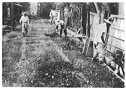
湖北小横通り舗装工事 湖北小学校横通り122メートルの舗装工事が進められています。完成は8月末の予定です。この後の工事は布佐通学道路修繕、4小横通り舗装などがあります。

①農地の移転、転用、登記などの問題。 ②遺族年金、恩給の受給問題。 ③公共施設の整備、促進。 ④生活保護等の社会福祉関係。 行政苦情は本人が口頭で申し出るだけで書類などはいりません。また、申し出のあった苦情については、千葉県行政監察局に連絡し、監察局ではいろいろ調査、あつせん処理をおこなうので、お知らせしなくても本人にお知らせしなくてもかまいません。