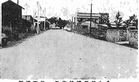
町道布佐・発作線舗装終わる 失対事業でおこなっていた町道布佐・発作線190メートルの舗装工事はこのほど終わりました。現在進められている町道舗装工事は湖北小横通りと橋本樹科医院～鈴木菓子店(湖北)の2路線です。