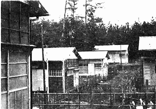
＜新木に完成した町営住宅＞

パーセント完了したとき、委員会で転用事実確認証明をします。それによって宅地に地目変更の登記をします。