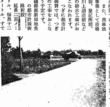
【完成した布佐通学道路】

印鑑証明書の発行を代理 理請求は委任状 印鑑証明書の発行を代理 人が請求する場合は、委任 状がないと発行しません。 代理人が請求する場合は 必ず委任状を添付して間違 いのないようお願いします。