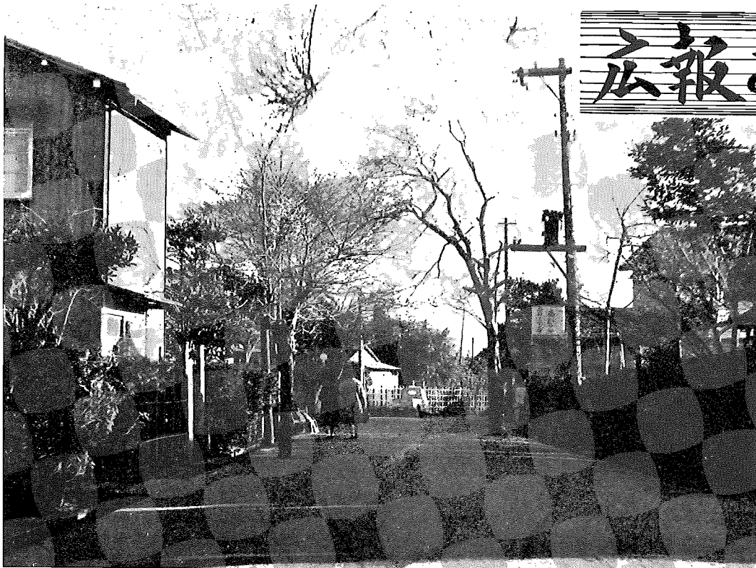
舗装化第一号の興陽寺通り