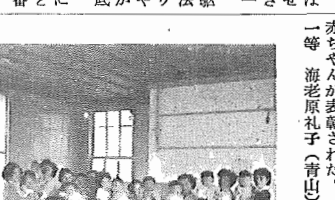
写真 表彰式場にて