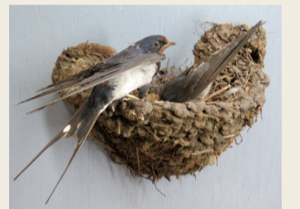
▲ツバメの巣のジオラマ