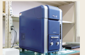
▲博物館にある電子顕微鏡