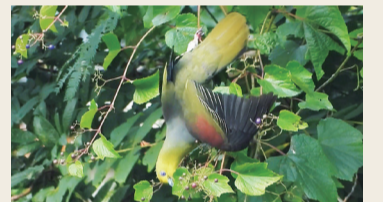
▲ぶら下がってノブドウを食べるアオバト