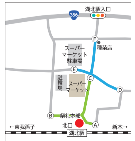
▼湖北祭交通規制図

18日(土)～20日(祝)12時は 下記 のとおり運行します。 ◎ あびバス 停留所「湖北駅北口」「マスダ前」は運休し「湖北駅入口」を仮設※ルート・時刻表は市ホームページをご覧ください。 ◎ つつじ荘送迎バス 停留所「湖北駅北口」は「南口」へ変更※運行時刻変更なし 問 交通規制…我孫子警察署☎04-7182-0110、阪東バス…阪東自動車(株)☎04-7185-2771、あびバス…交通政策課・内線20659、つつじ荘送迎バス…高齢者福祉センターつつじ荘☎04-7188-0123