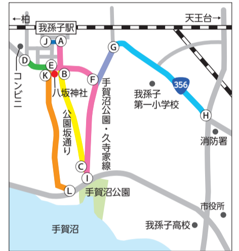
▼八坂神社祭礼交通規制図