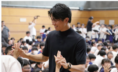
母校で中学生とハイタッチする中村選手▶

中村選手とハイタッチができてとてもうれしかったです。世界で活躍する選手を身近に感じられて、より憧れが強くなりました。好きなプレーは、サイドからの縦突破。ゴールラインまで駆け抜けるプレーが印象的です。ワールドカップでは、コーナーからのこぼれ球をダイレクトシュートでゴールを決めてほしいです。