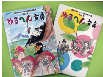
▲めるへん文庫第22・23集

※受賞者は令和9年2月に広報あびこ、図書館ホームページなどで発表します。 申 9月7日(月)(必着)までに応募フォームまたは作品と応募シート(事務局ホームページからダウンロード可)を郵送。〒105-0011東京都港区芝公園1の8の21芝公園リッジビル5階めるへん文庫事務局 問 図書館アビスタ本館 ☎04-7184-1110 ※めるへん文庫事業の担当部署が、教育委員会文化・スポーツ課から図書館に変更となりました。