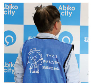
▲スローガンの書かれたゼッケンを着て活動しています

「すべては子どもたちの笑顔のために」というスローガンのもと、親や先生とは違う地域の大人として、一緒に遊びながら見守ることを心掛けています。子どもたちと遊ぶときは私たちが全力で遊びます。以前、かくれんぼで本気で隠れたら、全然見つけてもらえず少し寂しかったこともありましたが(笑)。子どもたちには自分で考え、挑戦しながら、失敗も含めていろいろな経験をしてもらいたいです。