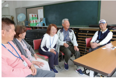
▲第一小学校出身で、同級生のサポーター5人

私たち5人は第一小学校出身で、昭和32年卒業の同級生なんです。定年退職した後、趣味のゴルフをしながら「せっかく地元にいるんだから、地域のために何かできることはないか」と思い小学校に相談したところ、あびっ子クラブのチャレンジタイムを紹介されました。ゴルフ仲間でもある同級生に声をかけるとみんな快く参加してくれて、活動を始めて今年で16年目です。