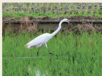
▲田んぼで餌を探すダイサギ