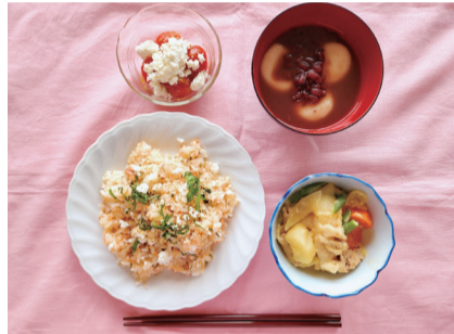
▲さけのミルクちらし寿司、肉じゃがなど

日時 6月16日(火)10時～13時 対象 市内在住の方 定員 先着20人(要申込) 費用 500円 持ち物 エプロン、三角巾、タオル、筆記用具 場所・申込 6月11日(木)までに健康づくり支援課(保健センター) ☎04-7185-1126