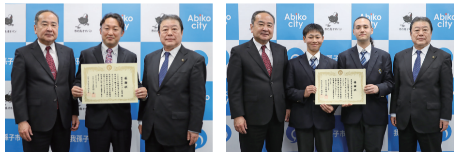
▲株式会社ニュー東豊様