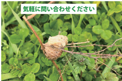
気軽に問い合わせください

30年以上農薬や化学肥料を使用していない畑で、おいしい野菜を作ってみませんか？※随時見学可 期間 3月1日(日)～令和9年2月28日(日) ※更新可 ※期間途中からの利用可 ※種子の共同購入可 所 北新田1552(1区画30㎡) ※駐車場、多目的ハウス、残菜置き場、井戸、トイレ、農具あり 費 1区画年額1万5,000円(別途消耗品・備品代1,000円) 申 問 電話・Eメールで氏名、電話番号を明示。玉根 ☎090-4022-3165 ☒youasa325musoujuku@gmail.com