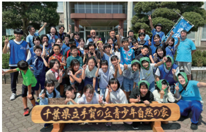
▲令和7年度の「夏泊 in 手賀の丘」の様子

毎年6月に開催する、子どもと大人が一緒に作り上げるイベントです。市民団体や福祉団体、学生ボランティアが協力して実施します。 活動期間 申し込み日～6月21日(日) 所 湖北地区公民館 内 委員会への参加(月1回程度)、イベントの準備・運営 申 問 七戸 ☎090-8558-9916