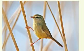
▲谷津田に春を告げるウグイス