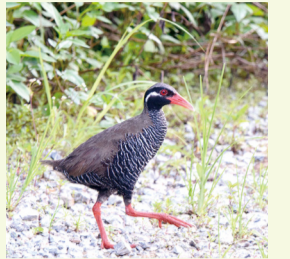
▲道路に出てきたヤンバルクイナ

内容 外来種のマングースやノネコなどの影響で、ヤンバルクイナの絶滅が危惧され、環境省などは生息状況の把握、外来種の除去などを行っています。また、野生個体数の減少に備えて、人工飼育下での繁殖と野生復帰技術の確立を目指しています。野生復帰のための試験放鳥の最新情報と、今後の課題についてお話しします。