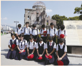
▲全員で平和を祈念