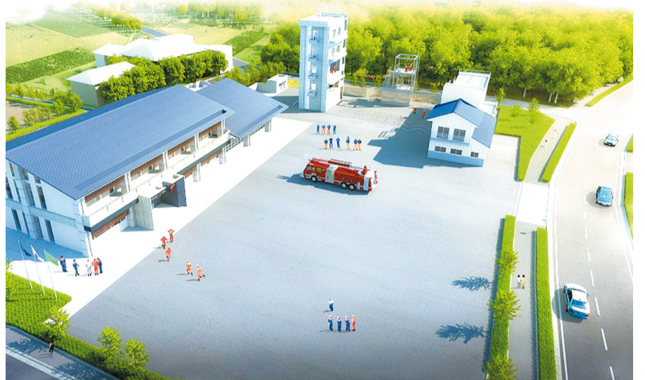
▲整備後の湖北分署と総合訓練施設(イメージ)