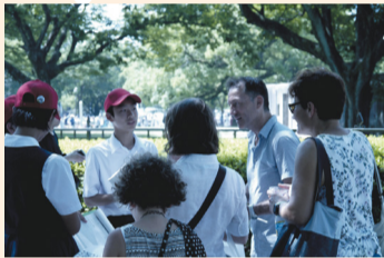
▲インタビューの様子