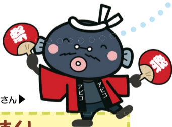
手賀沼のうなぎちゃん▶

主催 あびこカッパまつり実行委員会、我孫子市 ☎ 実行委員会事務局 ☎080-6652-9229、 ☎ http://abikokappa.net/