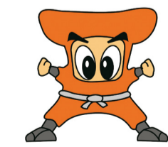
▲天王台商店会イメージキャラクター「天ちゃん」