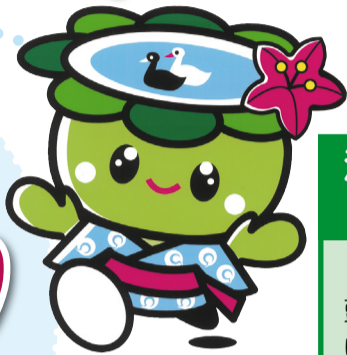
◀あびこカッパまつりイメージキャラクター「あびかちゃん」