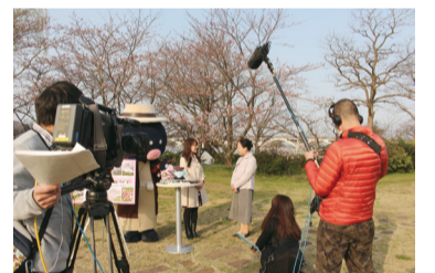
▲4月1日の生中継の様子