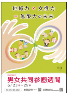
▲内閣府 平成27年度 男女共同参画週間ポスター

国は社会のあらゆる分野における指導的地位に占める女性の割合が、2020年までに少なくとも30%程度になるよう目標を掲げました。市もこれを目標に取り組んでいます。この中には自治会長も含まれています。まずは身近な「地域力」として、自治会の「女性力」を応援してみませんか。