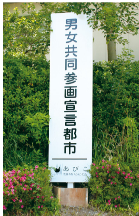
▲男女共同参画宣言都市看板

現を誓いました。その思いを次世代に伝えていくため、市庁舎に宣言都市の看板を設置し、独自に男女共同参画月間を定めました。今月は当