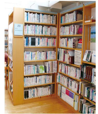
▲「男女共同参画社会の本」コーナー

図書館アビスタ本館に常設の「男女共同参画社会の本」コーナーがあるのを存じですか。女性の暮らしや生活に関するデータの本や、調べ学習に便利な新聞切り抜き雑誌などもあります。ぜひ手に取ってご覧ください。また今年度も9月と3月の発行に向け、情報紙「かがやく」を準備中です。カラー版でさまざまな特集を取り