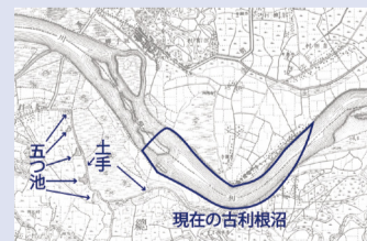
▲明治14年測量 迅速測図

利根川の流れは変わり、不要となった土手はいつしか忘れられていきましたが、そこに植えられた桜の木は利根川がかつてその地を流れていたと、後世に語りかけてくれるのです。