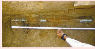
▲頭椎大刀の出土状態(保存処理前)

日時 2月20日(土)～23日(火)午前10時～午後5時 場所 あびこ市民プラザギャラリー (入場無料)