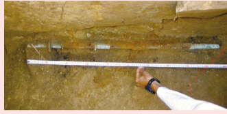
▲頭椎大刀の出土状態(保存処理前)

日時 2月20日(土)～23日(火)午前10時～午後5時 場所 あびこ市民プラザギャラリー (入場無料)