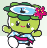
▲あびこカップまつりイメージキャラクター あびかちゃん