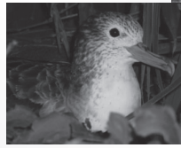
▲オオミスナギドリ