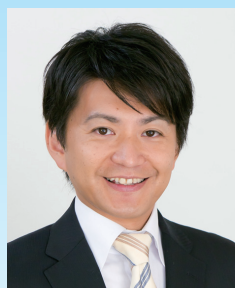
議長 茅野 理

新年あけましておめでとようございませう。地方が主体の時代を迎え、自立したまちづくりを進めていくために、市民生活に直結した市議会の役割と責務はますます増大しております。二元代表制の一翼を担う議会として、市長をはじめとする執行機関と健全な緊張関係を保ちながら、議員間の討議を十分重ね、最善となる意思決定をしていきたいと思っております。