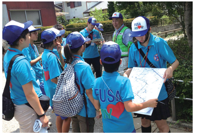
▲マップ作りで地域を調査する小・中・高校生たち

行って、課題を見つけて解決策を考える。地域とのかかわりを通じて地域の皆さんと一緒に完結させるという感じですね。小中一貫というのはカリキュラム、つまり教育課程が一貫ということ。上野 こうした取り組みも地域の方々の理解と協力があったからこそだと思います。小中一貫を進めることで、学校が統廃合になるのではないかと、い地域住民の皆さんのご心配もあります。市長