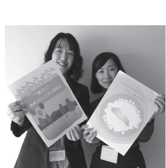
市民活動支援課・内線434

地域コミュニティ活性化基本方針を策定 この基本方針は、市民と市がそれぞれの役割のもと、地域課題に対応するしくみや、地域のさまざまな活動が活性化されるしくみ、市の地域への関わり方などを明らかにし、地域コミュニティを活性化するための指針となるものです。 ◎ 地域コミュニティ活性化のしくみ ・ 地域会議の設置 基本方針では、地域コミュニティ活性化のしくみとして、市内に地域会議の設置を提案しています。 △ 地域会議とは ・地域の暮らしをよくするために、さまざまな団体が話し合える場になります。 ・市内11の地域を基本として設けていきます。