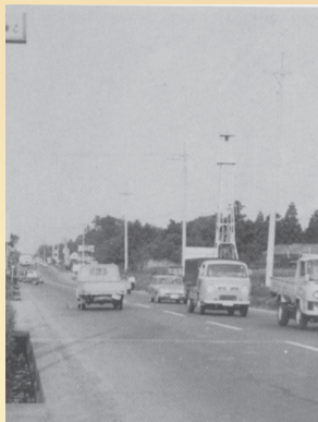
▲「我孫子みんなのアルバムから」より昭和35年ごろの国道6号

そもそも、我孫子に自動車が登場したのはいつごろでしょうか？それは、大正14(1925)年のこと。「大正15年度我孫子町事務報告」に「自動車1人」と記されています。また、昭和2(1927)年には我孫子初のバス(当時は乗合自動車と呼ばれていました)が市内を走ります。さらに昭和5(1930)年に栄橋、大利根橋が相次いで完成したことで自動車の普及が進みました。特に国道6号(当時は国道356号を我孫子第一小学校前から左折、柴崎を経由して大利根橋へ出るルート)は、霞ヶ浦航空隊と東京を結ぶ重要な軍用道路であったことから交通量が激増しますが、舗装もされておらず、雨が降れば泥濘となる状態でした。昭和16(1941)年、いよいよ国道改修が決まり、昭和24(1949)年には根戸から柴崎までのルートが市街地内を通らずに直線的に結ばれ、現在のルートとなるも路面は砂利敷きのまま。そして、昭和33(1958)年にようやく舗装されたのでした。