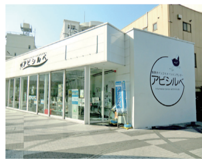
▲我孫子インフォメーションセンター「アビシルベ」

また、成田線、常磐線沿線の観光パンフレットも用意しています。電車での観光の際もアビシルベをご利用ください。