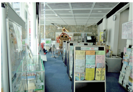
▲アビシルベ情報コーナー

アビシルベでは我孫子ならではの写真や伝統芸能などの企画展示を行っています。過去には、江戸神輿やステンドグラス、日本美術刺繍展も開催しました。展示内容や開催予定は、毎月1日号の広報あびこや市ホームページに掲載していますので、ご確認の上お越しください。