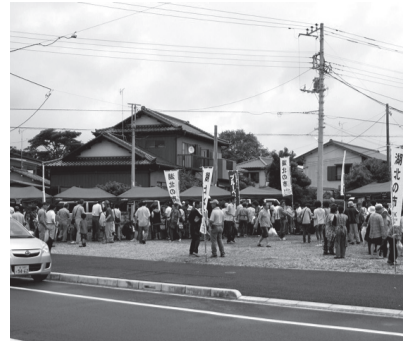
▲多くの人々で賑う「湖北の市」