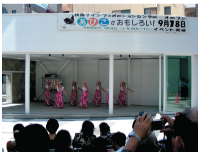
▲アビシルベステージでダンス

展示室を野外イベントステージとして活用することができます。ブラスバンド演奏やダンス、伝統芸能などジャンルは問いません。我孫子駅前のアビシルベステージで日ごろの練習の成果を披露してみませんか。