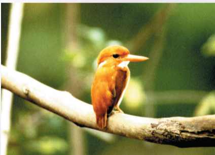
▲マダガスカルヒメショウビン

内容 山階鳥類研究所所員に、鳥に関するお話をしていただきます。今回は、アフリカのインド洋に浮かぶマダガスカル島の鳥や動物のお話しです。お話し終了後、フリートークの時間もあります。