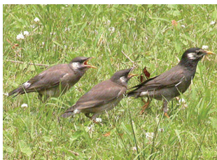
▲身近なムクドリ、好き、嫌い?

身近な鳥の生息状況は、私たちがくらす自然環境のバロメーターになります。これまで鳥の博物館で行ってきた我孫子市の鳥の生息状況調査をもとに、その結果からどんなことが読み取れるのか紹介します。身近な鳥たちの増減が、どんな意味を持つのか、みんなで考えてみましょう。