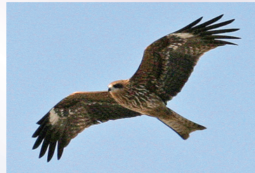
▲身近なタカの仲間「トビ」

内容 山階鳥類研究所所員に、鳥に関するとおきのお話しをしていただきます。今回は、だれでも知っている身近なタカの仲間「トビ」の知られざる生態についてのお話しです。お話し終了後、フリートークの時間もありますので、ぜひご参加ください。