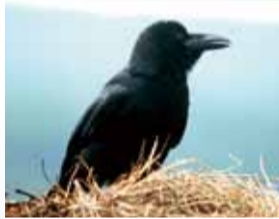
▲八重山諸島に特産するオサハシトガラス(ハシトガラスの亜種)