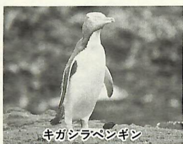
キガジラペンギン

鳥の博物館の第21回企画展は、ペンギンがテーマです。 一生の6割を海上で過ごすペンギンは、水中生活に最も適した「水中」を飛ぶ鳥です。