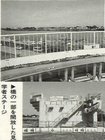
▼橋の一部を開放した見学者ステージ

建設工事が進められている沼とその周辺の景色を360度眺望できます。新しい手賀大橋は、両側に3・5メートルの歩道を備え、高さおよそ6メートル。手賀