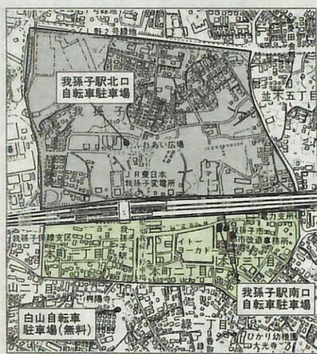
既に指定の区域 (緑) 今回指定の区域 (黄)