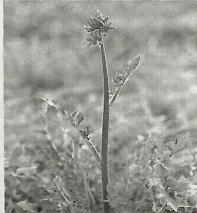
オニタビラコ (きく科)

最近、若者たちの間でマルチ商法やマルチまがい商法による被害が増えています。マルチ商法とは2万円以上の費用を払って商品やサービスなどの販売組織の会員になり、自分の下に子、孫などの販売員を増やすことで利益を得られるというものです。マルチまがい商法とは会員になるときの費用が2万円に満たないものをいいます。いつてもれればどちらもネズミ講式の販売組織です。