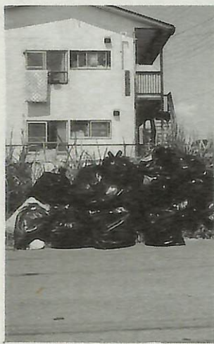
黒いビニール袋は使えません

「将来、複線化を検討する場合には、第一段階として我孫子・木下間が想定され、かつこの区間内での部分線増で検討することになり、その際は、地元負担も必要になります」との発言があり、これまでの回答より踏み込んだ具体的な内容でした。 これを受け期成会では、今年度から関係機関の協力を得て、成田線及び沿線地域の将来像や段階的整備計画などの調査を行い、早期複線化に向けて、より具体的な検討に入ることになっています。