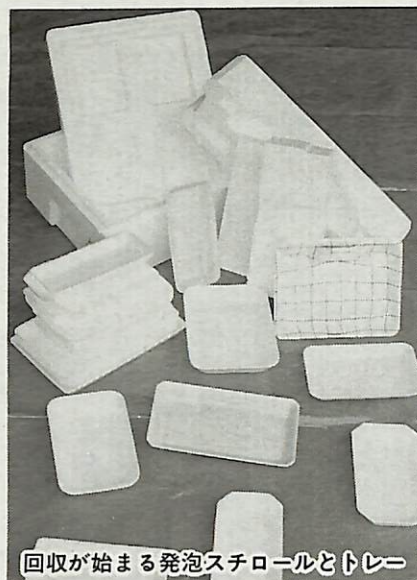
回収が始まる発泡スチロールとトレー