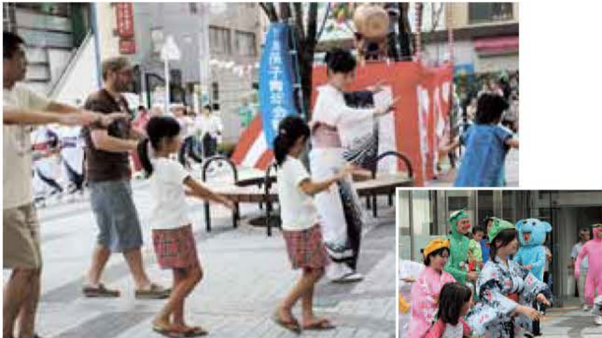
「第1回仮装かっぱ音頭まつり」 我孫子青年会議所主催 (平成19年8月26日)