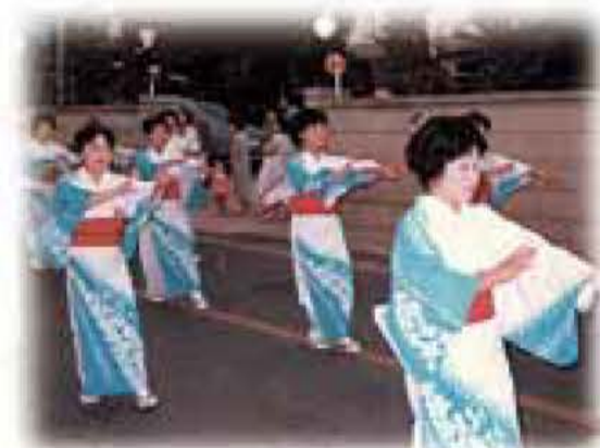
◀昭和59年の「かっぱ音頭大行進」

第1回「あびこカッパまつり」は、「かっぱ音頭大行進」を復活し、多くの市民の皆さんに親しまれ参加できるイベントを生み出し、元氣な我孫子を創り出すことを目的に開催されます。「復活!!あびこかっぱ音頭大行進!」「カッパ大音頭まつり」に期待ください。