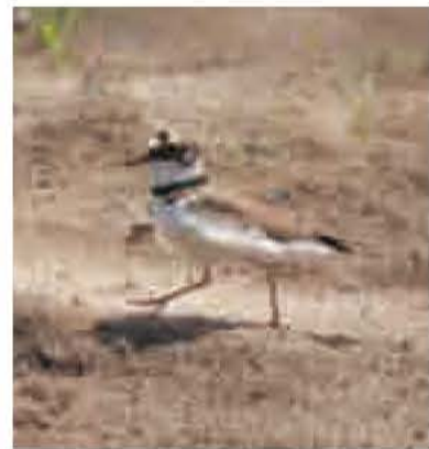
文：斎藤 安行（鳥の博物館学芸員）