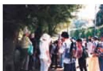
▲環境レンジャーでの観察風景

日時・集合場所 7月27日(日)午後7時(雨天中止)、東我孫子駅南側広場集合、午後8時30分解散予定 ※駐車場はありません。車でのご来場はご遠慮ください。