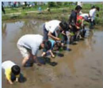
親子で田植え体験

申し込み・圖 往復ハガキに代表者の住所・電話番号、参加者全員の氏名・年齢、返信あて先を明記し、3月31日必着で〒270-1192 市役所手賀沼課(住所省略可)・内線467へ郵送