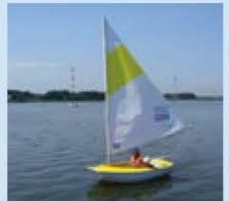
アクセスディンギー

申し込み・圖 往復ハガキに「チャレンジ手賀沼博士」、参加者全員の住所・氏名・電話番号・学年・希望の時間、返信用のあて先(裏面は未記入)を明記し、3月7日必着で〒270-1192 市役所手賀沼課(住所省略可)・内線568へ