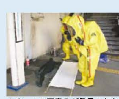
▲ホームで不審物が発見されたという想定で訓練する処理班

2月7日に我孫子警察署、我孫子消防署合同の特殊災害対応訓練(テロ想定訓練)が、JR我孫子駅で行われました。 この訓練は、テロ災害時の関係機関の通報、救護、処理など一連の動作を確認することを目的に、我孫子駅8番線ホームに不審物が発見されたという想定で、警察署員、消防救助隊員が連携して、負傷者の救出、不審物の処理・回収などを行いました。 訓練終了後、我孫子警察署長は「訓練は、関係機関の協力により迅速に行われました。また、市長は「日ごろの訓練が大切です。市民の安全安心のため、日々努力してください」と話しました。