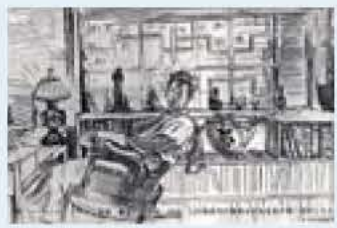
▲バーナード・リー氏作「書斎の柳宗悦」（日本民藝館所蔵）

日時 3月15日（土）、午後2時30分（2時開場） 場所 けやきプラザふれあいホール（JR我孫子駅南口） 内容 柳宗悦を我孫子で語る