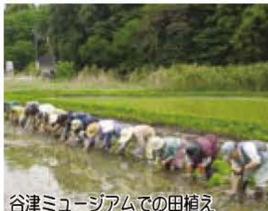
谷津ミュージアムでの田植え

市では、岡発戸・都部の谷津を舞台に、昭和30年代の農村環境の復元をめざした谷津ミュージアム事業を進めています。