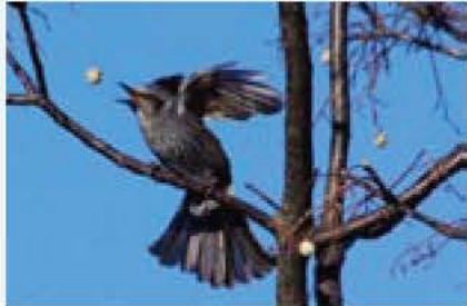
▲センダンの実をくわえ直す瞬間 文 寺田夏芽(鳥の博物館学芸員)

ヒヨドリは、数が多くどこでも見られる身近な鳥です。「ヒヨコ、ヒヨコ」というあの騒がしい鳴き声が、この鳥の和名の由来だと言われています。本来、夏は山で暮らし冬になると人里におりてく