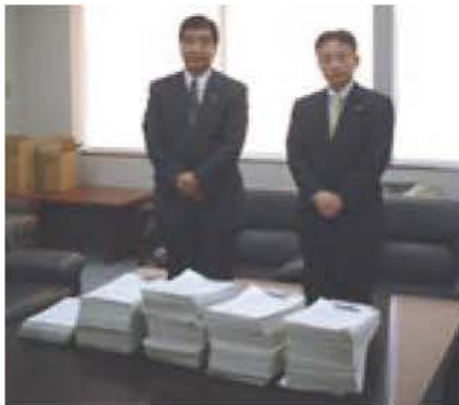
JR東日本東京支社で

署名活動、自治会回覧などを 長は我孫子市長」が実施。東 我孫子駅から下総松崎 駅の各駅での署名活動、 市内の自治会回覧など を合わせ、総数は4万 3795人でした。 両署名の合計は、9 万289人となりました た(内訳は下表)。多 くの皆さんの協力を いただき、ありがとうございました。 また、両支社長に、成田線複 線化促進期成会がまとめた「成 田線(我孫子〜成田間)輸送改 善調査」としてまとめました。