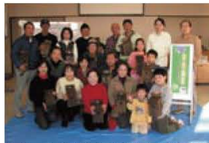
▲作った巣箱と記念撮影(昨年度)

シジュウカラは、庭先でよくみかける身近な鳥です。白い頬に黒いベレー帽、おなかのネクタイ模様が人気の小鳥です。 シジュウカラは本来、木の洞に巣をつくる鳥ですが、林が少なくなってきた今では、コンクリート塀のすき間や庭に伏せた鉢、郵便受けなど、私たちの身近な場所を巣場所に使います。そして、巣箱も好んで使います。 巣箱教室では、巣箱を作るだけではなく、巣箱のかけ方や観察のコツ、巣箱の手入れなども学びます。 日時・場所 12月9日(土)午後1時