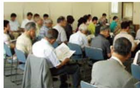
▲設立総会には多くの市民が参加