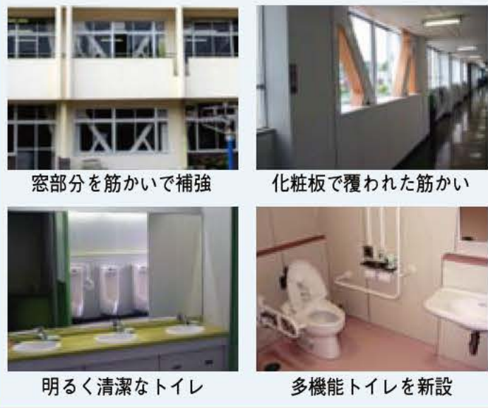
窓部分を筋かいで補強