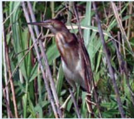
文 斉藤安行(鳥の博物館学芸員)