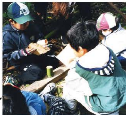
古利根公園自然観察の森(2カ所)

平成8、10年に市で取得。みどりのボランティアの指導による里山あそび(竹細工)などを行っています。