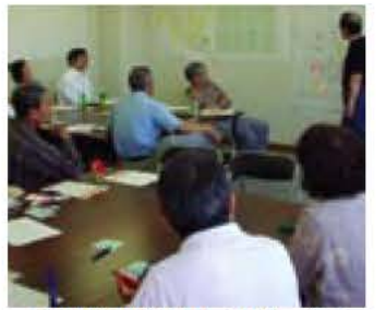
▲地域の皆さんとの話し合い

布佐駅南側の駅前周辺について、地域の自然、歴史、地形などの特性を活かした「魅力ある拠点づくりとは何か」について皆さんの意見を募集します。 我孫子市は、我孫子・天王台・湖北・新木・布佐の各駅を中心とした5つのまとまりを持った