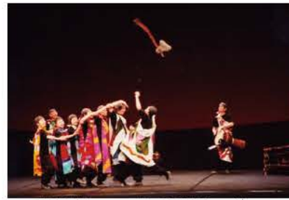
エネルギッシュなアフリカダンス

宮沢賢治の「ペンネンネン ンネン・ネネムの伝記」を原作 に、アフリカに広く伝わる民俗 楽器（アフリカン・ドラム、マ