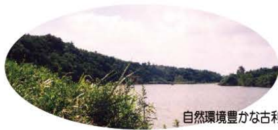
自然環境豊かな古利根沼