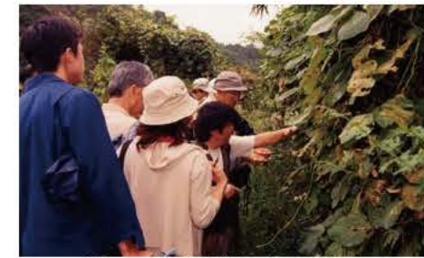
前回の自然観察会の様子

の言葉で、「いのち」の意味の 擬声語です。 日時 12月21日(日)午後1時30分 開場、2時開演 場所 市民会館 入場料 1000円(全席自由) (子ども優先席あり) ※入場券10人分をご購入いただ いた団体には、付き添い券1人 分をお付けします(取り扱いは 教育委員会でのみ)。 入場券販売所 市民会館内売店 ひろがり、ブックインひらが、 ミリオン楽器我孫子店、荒井書 店、東京事務器、写真のおちあ い、柏高島屋友の会、取手とう きゆう 教育委員会文化課 ☎718 5・1151 ※10人以上の団体はバス送迎あ り。詳しくは、文化課へお問い 合わせを。