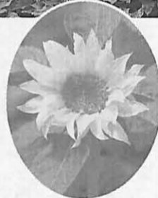
▶まもなく満開に(根戸新田のひまわり畑)

市あゆみの郷公社では、手賀沼沿いの美化とにぎわいを図るため、土地所有者と共同でひまわりの種をまきました。 このひまわりは、8月下旬ころに満開になると思われま 開花時には、花摘みができる区画があります。ぜひ、おでかけください。 場所 根戸新田(手賀沼ふれあいライン沿い) 面積 約5000㎡ 問い合わせ 市あゆみの郷公社 ☎83-1130(土・日・月を除く)