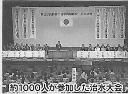
約1000人が参加した治水大会

第52回利根川治水同盟治水大会が8月2日、市民会館で開かれました。 この同盟は、1947年(昭和22年)に関東を襲ったカスリーン台風によって利根川流域の市町村が甚大な被害を受けたこ