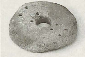
▲これらは何に使われたものでしょう(答えは展示会で)

今年で3回目を迎える考古遺物展示会。 今回は「考古学 なぞの? 展示会」という題名で、市内で出土した遺物の中から、考古学者でも使い方のわからないものや、現代の私たちには見ただけでは使い方のわからない「なぞの」遺物を集めて展示します。 夏休みの一日に、古代人たちが残した「なぞ」に挑戦してみたいかがですか。 日時 8月18日(土)から21日(火)午前10時から午後7時 場所 市民プラザ 展示解説 午前11時、午後2時、5時(1回30分程度) 入場料 無料 問い合わせ 教育委員会文化課(85)1151