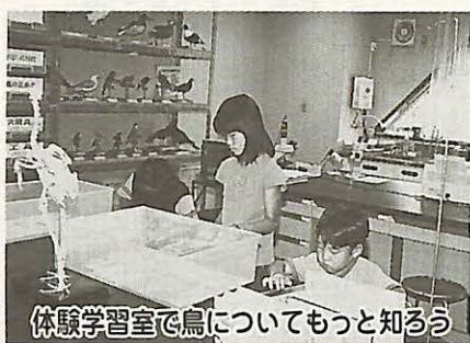
体験学習室で鳥についてもっと知る