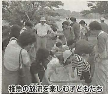
稚魚の放流を楽しむ子どもたち

手賀沼のほとりて鳥を見たり、音楽を聞いたり、絵を描いたり、手賀沼に「ふるさと」を感じ一日、「エンジョイ手賀沼」は、一人ひとりに手賀沼とのかかわりを考えていただきながら、楽しい一日を過ごそうというイベントです。 日時 5月13日(日)午前9時から午後3時(雨天実施) 場所 手賀沼親水広場