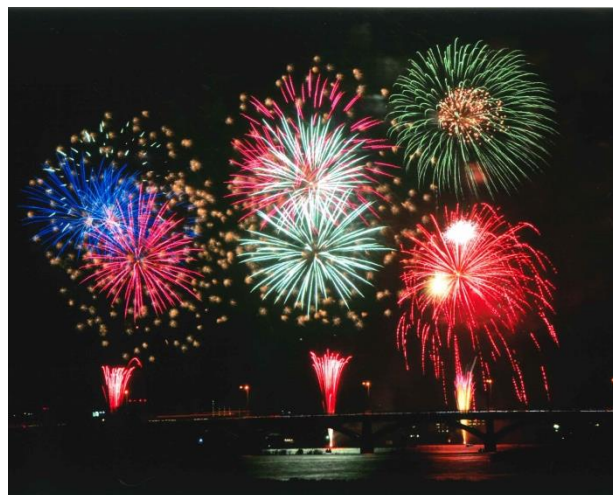
手賀沼花火大会(夏)