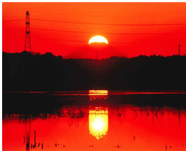
ダイヤモンド富士(冬)